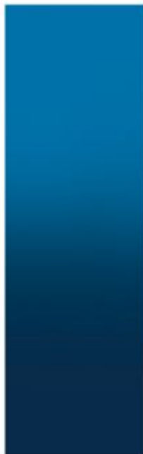
Подложка без звезд

C 95 R 8 HEX 1 M 44 G 111 086fad Y 9 B 173 K 7